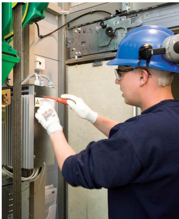
Vores erfarne moderniseringsteams sørger for, at arbejdet fuldføres til tiden og inden for budgettets rammer.