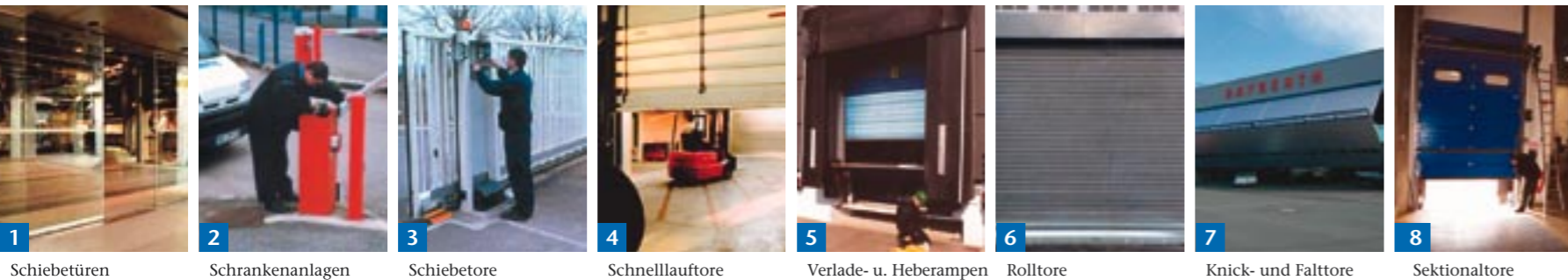
1 Schiebetüren 2 Schrankenanlagen 3 Schiebetore 4 Schnelllaufstore 5 Verlade- u. Heberampen 6 Rollstore 7 Knick- und Falttore 8 Sektionaltore

Servicetelefon 24-Stunden-Notruf: (01805) 56 63 62 (14 Cent/Min.)