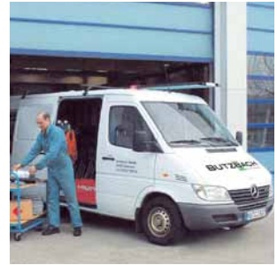
Onderhoud en modernisering