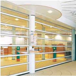
Scheidingswanden / Etalagepantser