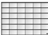
Glasad ned till marknivå – maximalt ljusinsläpp och sikt.