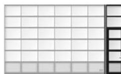
Sektionsport med sidodörr i en sidosektion med samma utseende som porten.