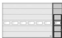
Fönstersektion och sidodörr i en sidosektion med samma utseende som porten.