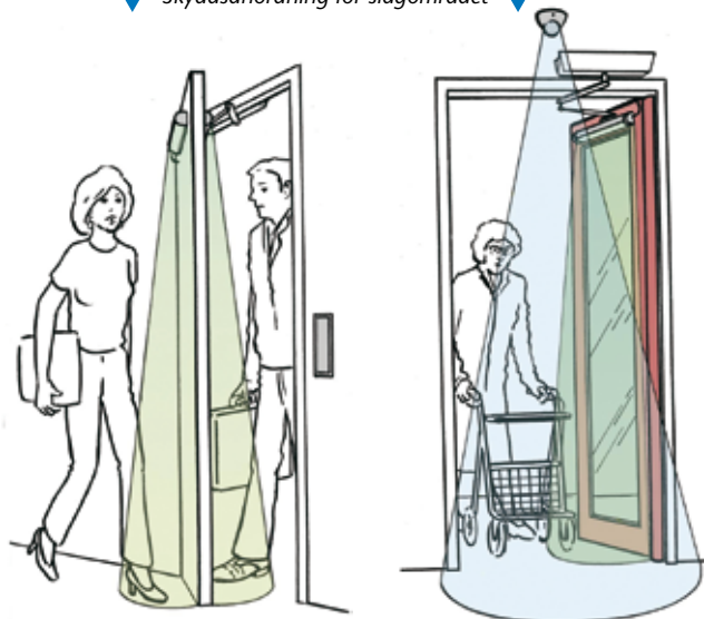
▼ Skyddsanordning för slagområdet ▼