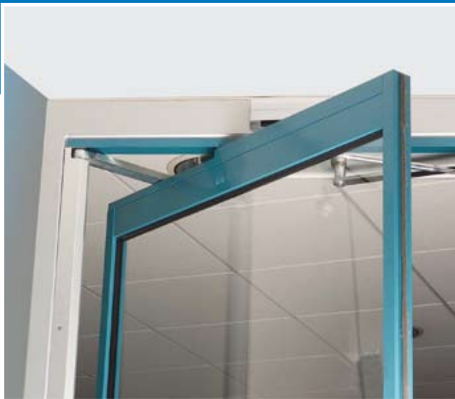
▲ Enkel slagdörr i balansversion.

KONEs slagdörr är en kraftfull, helautomatisk slagdörrsmekanism som lämpar sig såväl för dörrar av standardtyp som för större och tyngre dörrar. KONEs slagdörrssystem är flexibelt och kan anpassas så att det uppfyller kraven hos många olika sorters miljöer. Dörröppningarna kan även anpassas och ändras med hjälp av en användarvänlig programmeringsenhet.