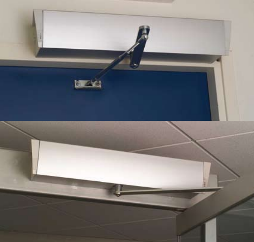
▲ Enkla slagdörrar