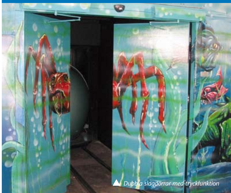
▲ Dubbla slagdörrar med tryckfunktion